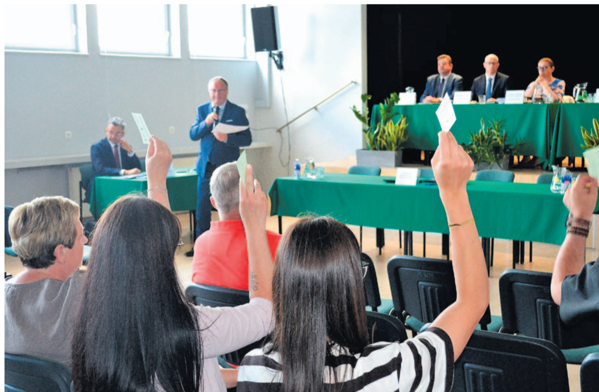
Mieszkańcy potwierdzali swoje decyzje w głosowaniach.

Członkowie Tyskiej Spółdzielni Mieszkaniowej „OSKARD” wzięli udział w dorocznym Walnym Zgromadzeniu. Jego głównym punktem – poza udzieleniem absolutorium dla Zarządu – było ustalenie nowego składu kończącej swą trzyletnią kadencję Rady Nadzorczej.