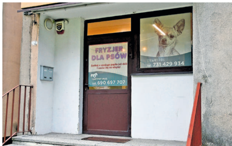
„Gryfny Pies” znajduje się na parterze bloku przy al. Piłsudskiego 75.

Niniejszy odcinek cyklu artykułów o przedsięwzięciach prowadzonych w lokalach należących do zasobów TSM „OSKARD” w zasadzie jest adresowany do tych naszych domowników, którzy nie potrafią czytać. Mowa oczywiście o czworonogach, a konkretnie ukochanych pieskach. Można zatem ten tekst przeczytać na głos swojemu pupilowi, gdyż – jak zapewniają nasze dzisiejsze rozmówczynie – ich klienci rozumieją więcej niż się czasami właścicielom wydaje. Tym razem odwiedziliśmy dwa zakłady groomerskie, a wywiadów udzieliły nam dwie fryzjerki. Jeszcze niedawno zawód ten mógł się wydawać egzotyczny, ale podobne salony piękności dla psów wpisały się już na dobre w miejski krajobraz.