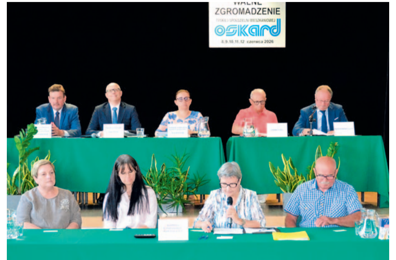
Obok członków Zarządu TSM „OSKARD” podczas zebrania zasiadali wybierani każdorazowo członkowie Prezydium i Komisji Mandatowo – Skrutacyjnych.

Identyfikacyjnym zdaniem był niezależny biegły rewident, na opinii którego oparła się Rada Nadzorcza, wysoko oceniając pracę Zarządu TSM „OSKARD” i wnioskując o zatwierdzenie sprawozdania finansowego Spółdzielni za 2025 rok. Zgodzili się z tym obecni na zebraniach mieszkańcy, podejmując stosowną uchwałę.