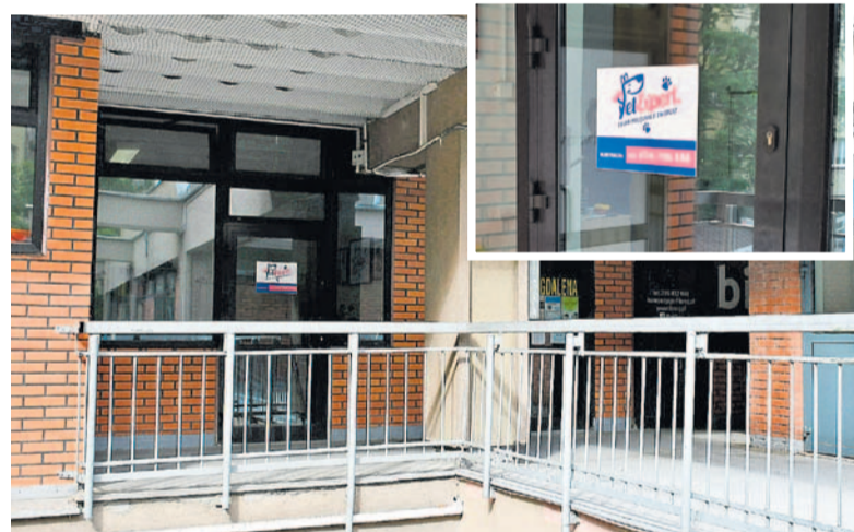
„PetExpert” usytuowany jest w zespole pawilonów usługowych przy ul. Dmowskiego 2-4.